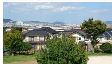
2階からの景色です。