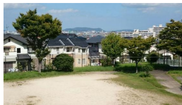
1階からの景色です。